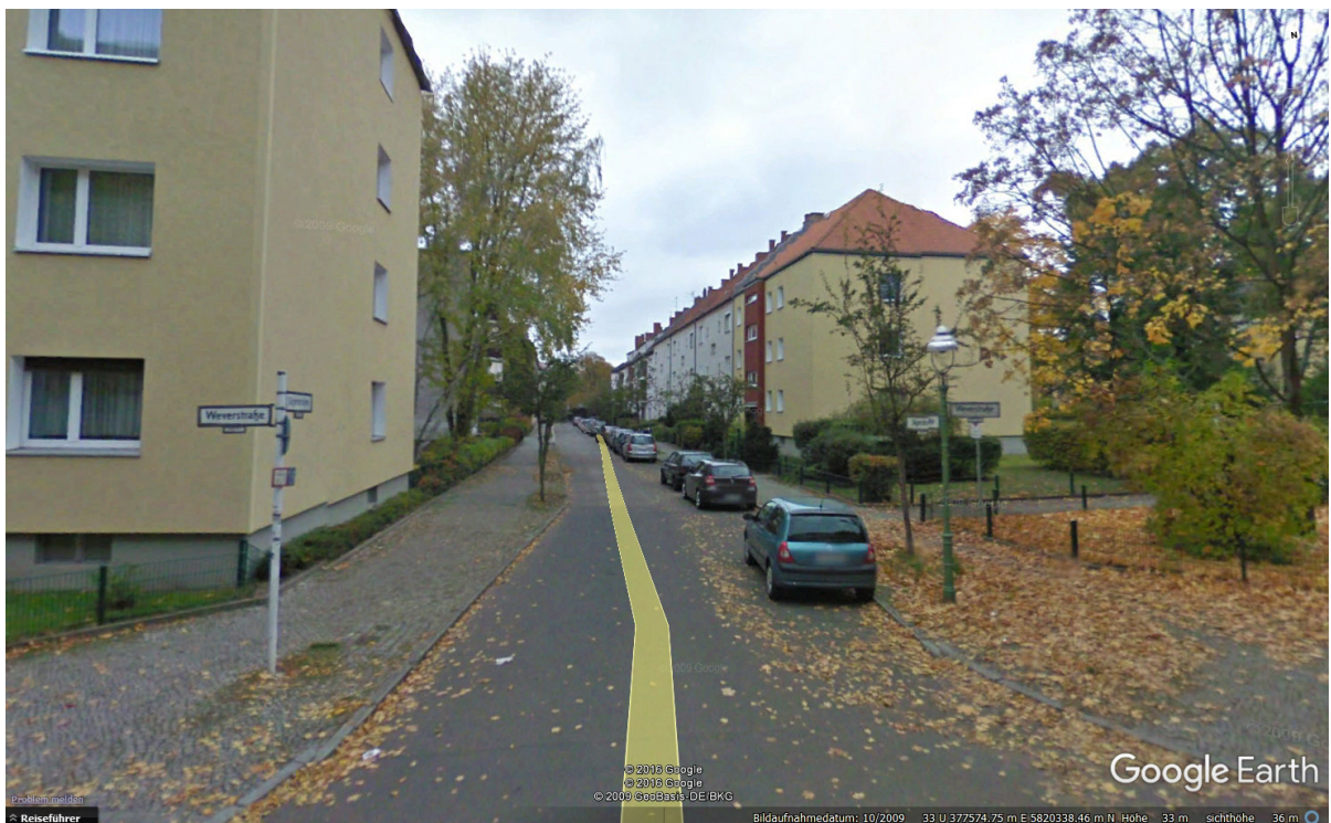
Jägerstraße zw. Wever- Jordanstraße