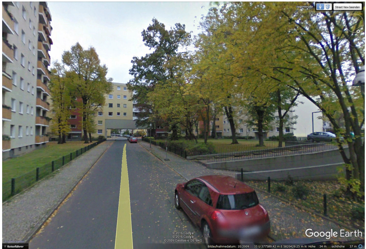
Jägerstraße zw. Beyer- und Weverstraße