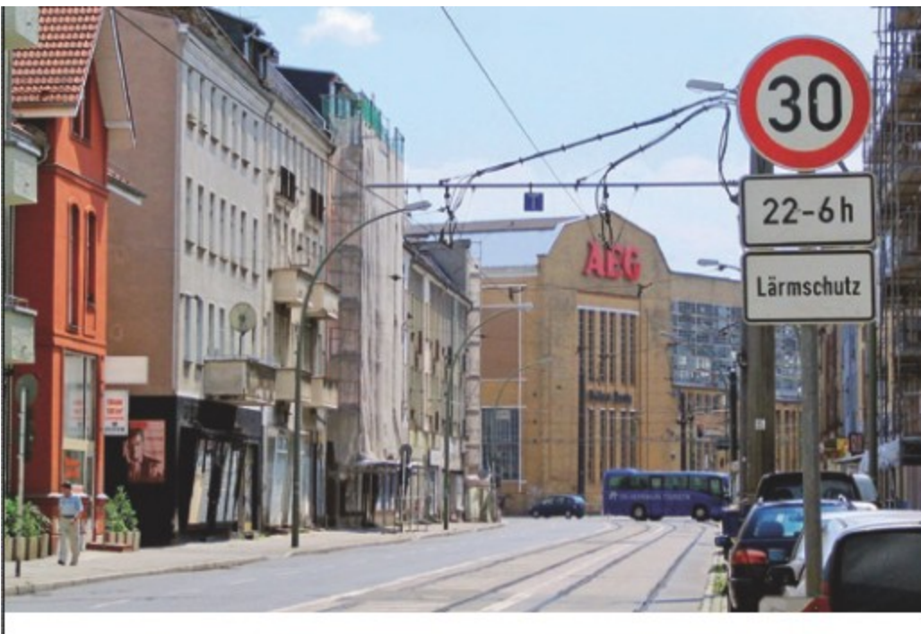
Tempo-30-Limit: Ruhigere Straßen bringen mehr Lebensqualität.

Bildschirmfotos aus der Broschüre „Ruhiger leben in der Großstadt“, Seite 11: